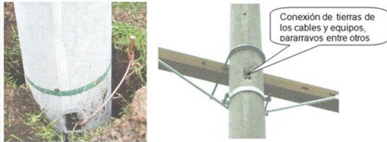
Figura No. 4. Conexiones inferior y superior al electrodo de Puesta a