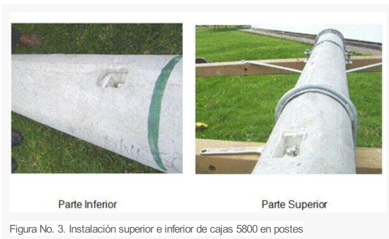
Figura No. 3. Instalación superior e inferior de cajas 5800 en postes

Cada poste debe incluir dos de estos kit, uno en la parte superior para la conexión a tierra de protecciones y equipos y otro en la parte inferior para la conexión a la varilla de puesta a tierra .