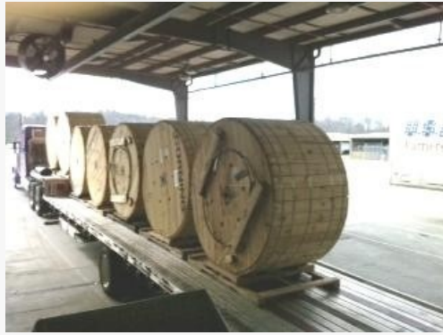
Figura 2: Carreta(imagen de referencia)

Para efectos de pruebas de entrega en bodegas de ENEL CODENSA o en el lugar que ENEL CODENSA destine, los extremos interior y exterior del cable deberán estar disponibles para pruebas, ambos extremos del cable deberán estar tapados para prevenir el ingreso de humedad, cada carrete deberá tener adjunto una etiqueta resistente al clima identificando el carrete, el tipo de cable y los datos de la fábrica.